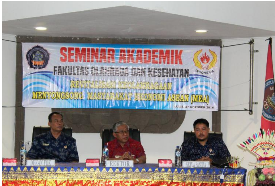
Gambar 6. Kegiatan Seminar Akademik Undiksha