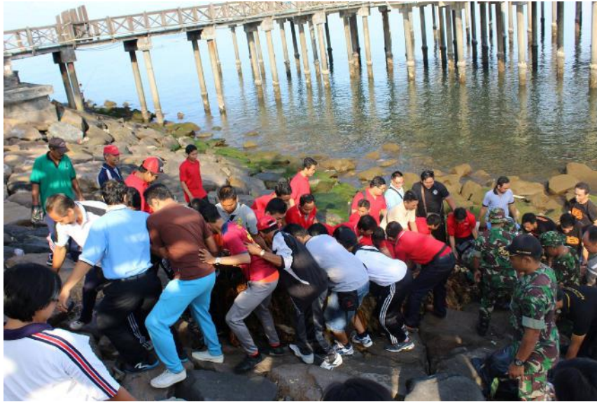
Gambar 4. Kegiatan Bakti Sosial Undiksha Tahun 2016