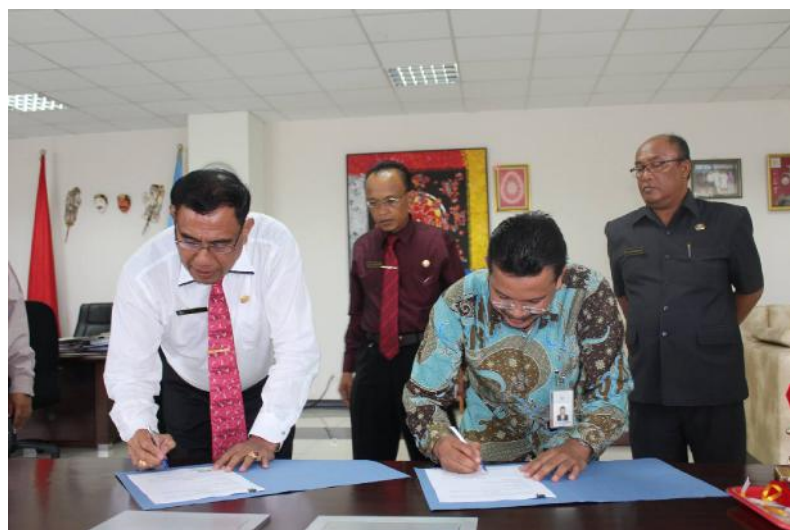
Gambar 7. Rektor Undiksha menandatangani MoU dalam negeri

Di Tahun 2016 ini merupakan capaian yang cukup luar biasa bagi Universitas Pendidikan Ganesha dalam hal pembuatan MoU/MoA dengan pemerintah, universitas, ataupun instansi lainnya. Dengan jumlah MoU/MoA dengan mitra dalam negeri sebanyak 24 MoU/MoA. Untuk detail MoU dalam negeri Undiksha Tahun 2016 dapat dilihat pada tabel MoU Dalam Negeri.