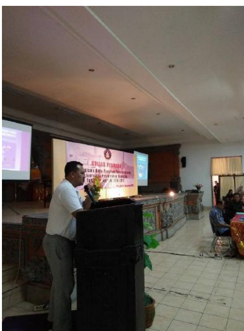
Gambar Kuliah Umum Undiksha.

Undiksha juga telah mengadakan kegiatan mengundang dosen tamu (kuliah umum) salah satu contohnya narasumber workshop persiapan kurikulum prodi pendidikan dokter, dan narasumber kegiatan seminar nasional MIPA. Untuk kegiatan pengadaan bahan perkuliahan juga telah terealisasi dengan baik sehingga indikator ini realisasi fisiknya (capaian kinerja) 100%.