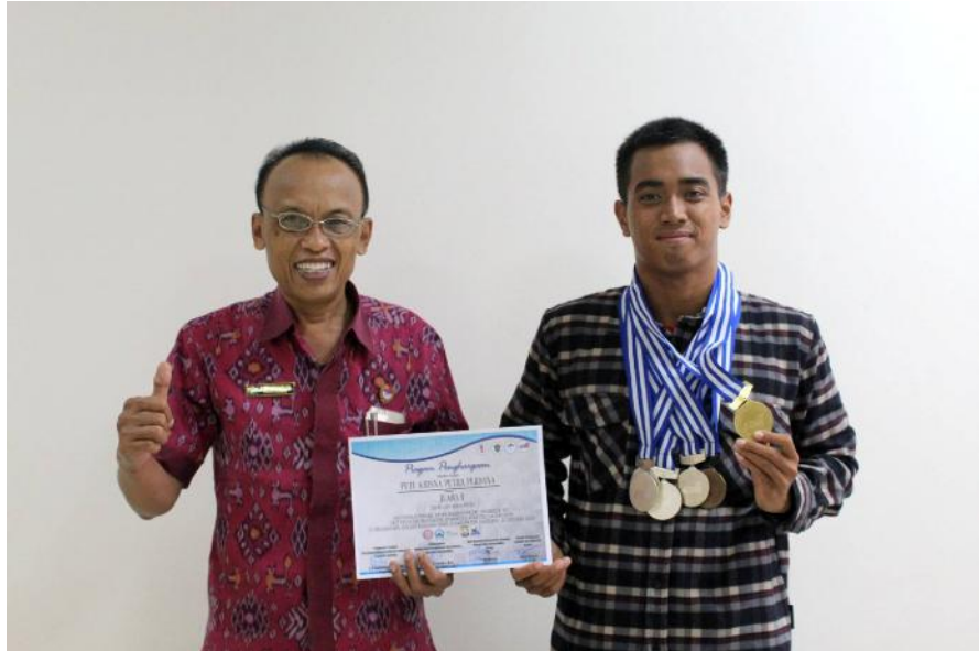
Gambar 3. Wakil Rektor III dan Pemenang 1 Kejuaraan Lomba Renang antar mahasiswa se-Indonesia