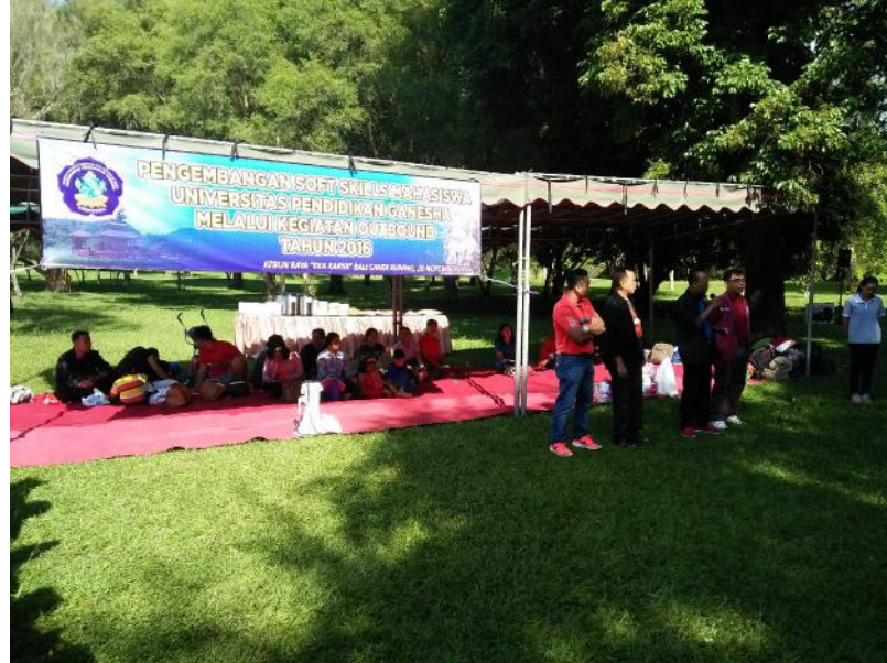
Gambar 2. Pengembangan Softskill Mahasiswa Melalui Kegiatan Outbond Tahun 2016