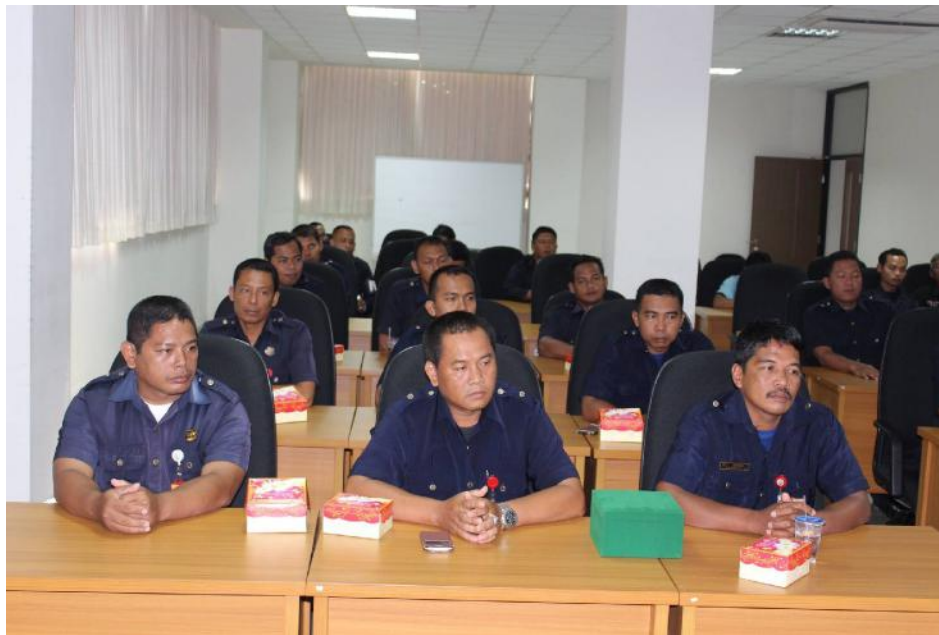
Gambar 9. Diklat staf Pengamanan Kampus Tahun 2016

Indikator ini meliputi kegiatan workshop tenaga kependidikan, seminar workshop profesional tim 3S dan staf UBK, mengikuti pelatihan pengembangan sistem informasi, mengikuti bimtek penggunaan computer assisted test (cat) berbasis sistem uji kompetensi guru, studi banding tenaga kependidikan ke perguruan tinggi lain, KONASPI. Realisasi fisik indikator ini sudah mencapai 100%.