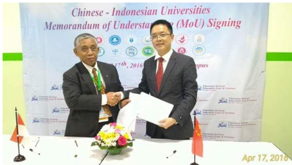
Gambar 8. Wakil Rektor IV melakukan MoU kerjasama luar negeri

Untuk MoU kerjasama luar negeri Undiksha telah membangun kerjasama international dengan melibatkan berbagai universitas di luar negeri dari benua Eropa, Amerika, Australia, dan Asia, baik itu yang sudah memiliki MoU maupun dalam tahap penjajagan kerjasama.