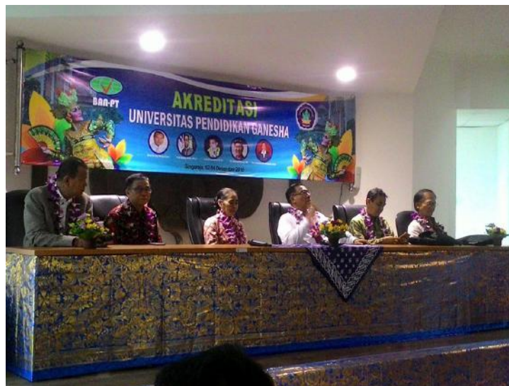
Gambar 5. Kegiatan Akreditasi Universitas Pendidikan Ganesha Tahun 2016

Sasaran strategis semua jurusan/program studi berstatus akreditasi dengan sekurang-kurangnya 85% berada dilevel baik atau unggul diukur dengan indikator kinerja yaitu :