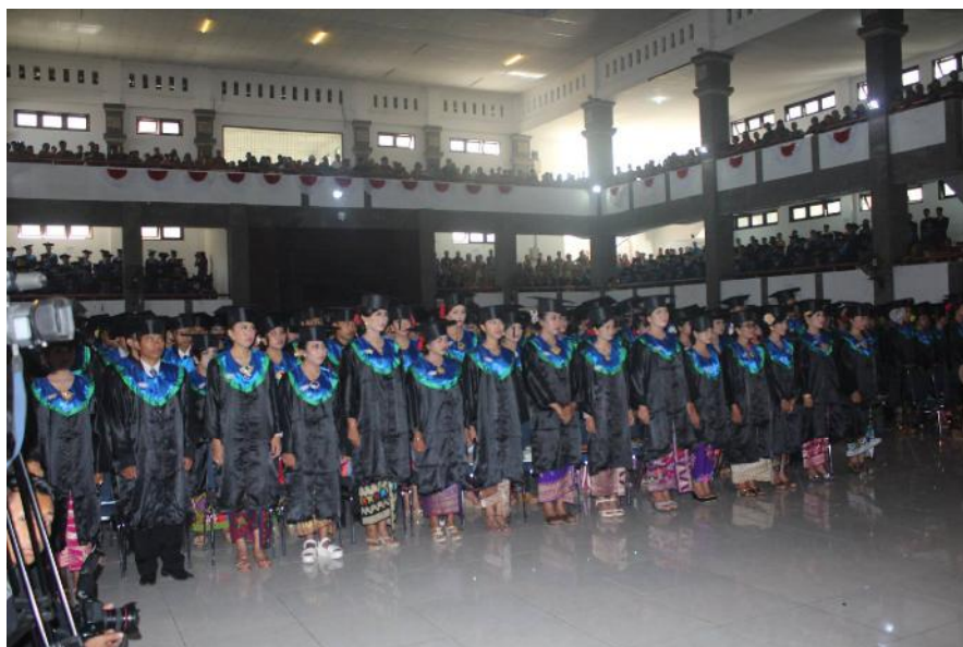
Gambar 10. Acara Wisuda Undiksha.