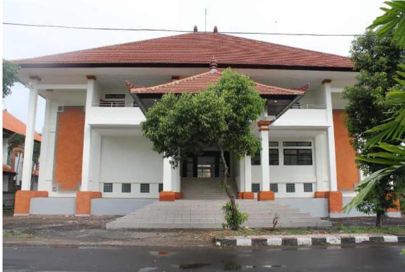
Gambar 1. Gedung Laboratorium dan Gedung Kuliah Teknik Mesin