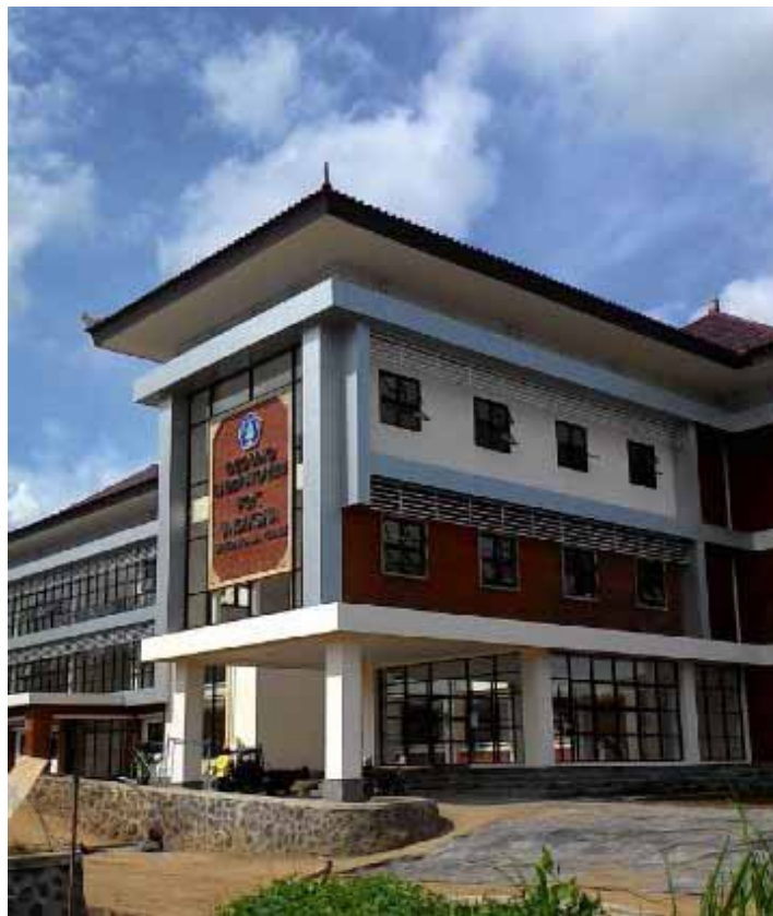
Gbr. Kampus Fakultas Olahraga dan Kesehatan